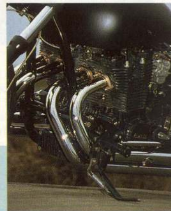
Po zralé úvaze dostal šanci čtyřdobý, vzduchem chlazený čtyřválec Yamaha FJ 1100.

také proto, že sekundárním převodem mohl být jedině řetěz umožňující na rozdíl od kloubového hřídele použití extrémně širokého zadního ráčku. Šířka kol obutých pneumatikami Matador 200/70-15" vpředu a 205/70-14" vzadu je opravdu impozantní. V milimetrech to dělá 215 na předním a 240 (!) na zadním kole. Při této šířce pneumatik je více než jindy třeba brát v úvahu ostatní rozměry mající ve finále podstatný vliv na celkovou ovladatelnost motocyklu. Jedná se o rozvor, úhel hlavy řízení a závlek kola. Optimum nakonec odpovídá hodnotám 1700 mm, 52 stupňů a 158 mm. Rám je svařen z ručně ohýbaných chromomolybdenových trubek kruhového průřezu 35 mm. Teleskopická vidlice, pů-