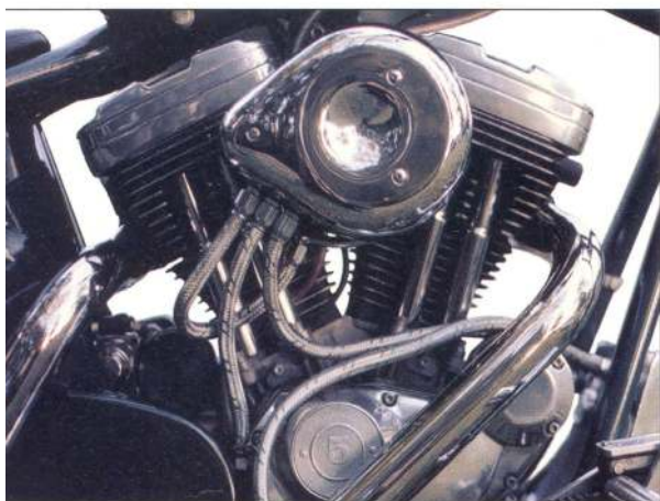
vlevo: Naleštěný motor má kromě svých stříbrných ploch ještě jednu ozdobu, a tou jsou ocelí opletené hadice, jež vedou ze všech oddechových otvorů v motoru přímo do vzduchového filtru.

MOTOR JE VÍCEMĚNĚ SÉRIOVÝ MODEL XL 1200 SPORTSTER (MOTOR I PŘEVODOVKA V JEDNOM BLOKU), KTERÝ PROŠEL DŮKLADNOU LEŠTÍCÍ PROCEDUROU.