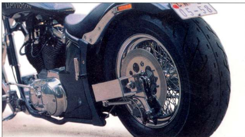
část milovníků jedné stopy brání a štítem jim je většinou srovnější cifra v ceníku.

Svět nejstarší existující značky na světě prostě není jednoznačný ani jednoduchý. Vyžaduje trochu porozumění, trochu citu, abyste si různé chutě tohoto světa mohli vychutnávat z plna hrdla a nenechali